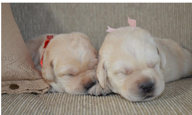
Immagine di due cuccioli di labrador biondi che dormono vicini. Saranno futuri cani guida.

I richiedenti già assegnatari di un cane guida devono inoltre allegare alla domanda un certificato redatto da un medico veterinario attestante l'inabilità alla guida del cane oppure il suo decesso e la riconsegna dei finimenti alla scuola.