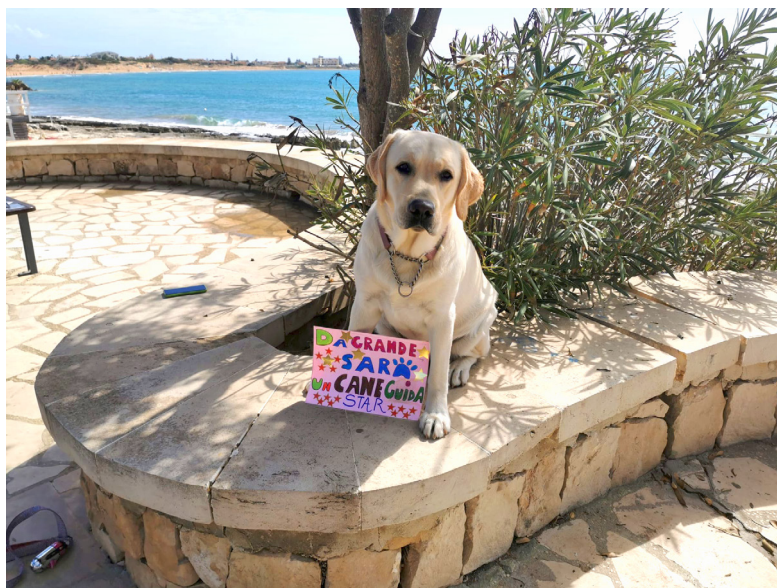
Immagine di Star, labrador biondo, futuro cane guida, seduta su un muretto in pietra, sullo sfondo un albero e dietro il mare, con un cartello "Da grande sarò cane guida"