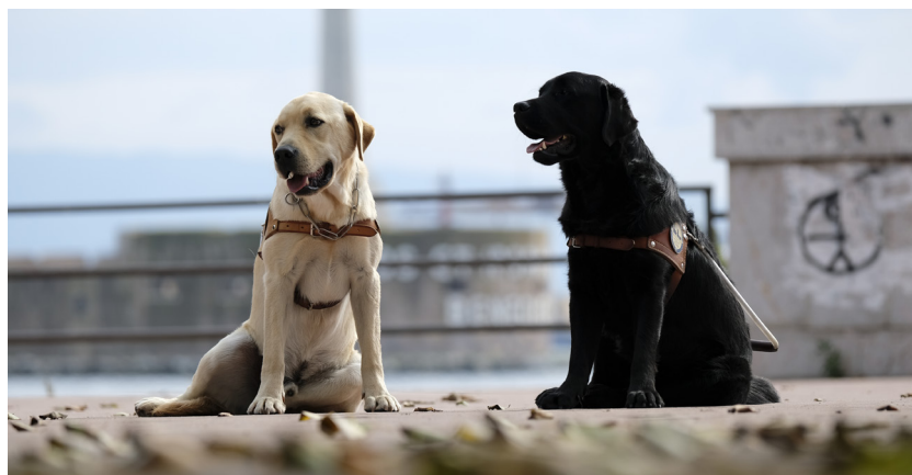
Immagine di due labrador, uno biondo, l'altro nero, al porto di Messina. Sono seduti e indossano la pettorina di riconoscimento.

Centro Autonomia e Mobilità - Scuola Addestramento Cani guida per ciechi dell'ANPVI Onlus-Aps Egidio Riccelli Strada di Cappelluzza 1 00063 Campagnano di Roma (RM) Tel. 0670614580 – 3351551005 email : centroautonomiamobilita@anpvionlus.it