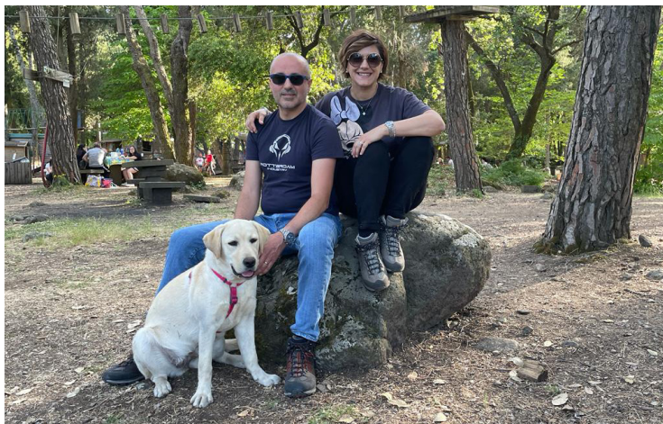
Immagine di una famiglia affidataria, con un labrador biondo, futuro cane guida, in un'area picnic durante un'escursione in montagna