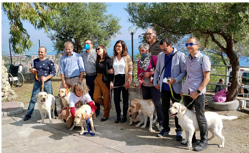
Immagine di un incontro con le famiglie affidatarie che riconsegnano i cani guida alla Scuola, per l'inizio dell'addestramento

L'Art. 7 comma 2 del Reg. CE n. 1107/2006, riguardo al viaggiare in aereo in cabina con il cane guida, addestrato da una scuola riconosciuta dall'IGDF, stabilisce: "Qualora sia richiesto l'impiego di un cane da assistenza riconosciuto, esso sarà reso possibile purché ne sia fatta notifica al vettore aereo, al suo agente o all'operatore turistico, in conformità delle norme nazionali applicabili al trasporto di cani da assistenza a bordo degli aerei, ove tali norme sussistano.