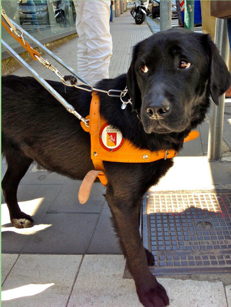
Immagine di un cane guida, labrador nero, che indossa la pettorina di riconoscimento, mentre accompagna il suo conduttore per la città