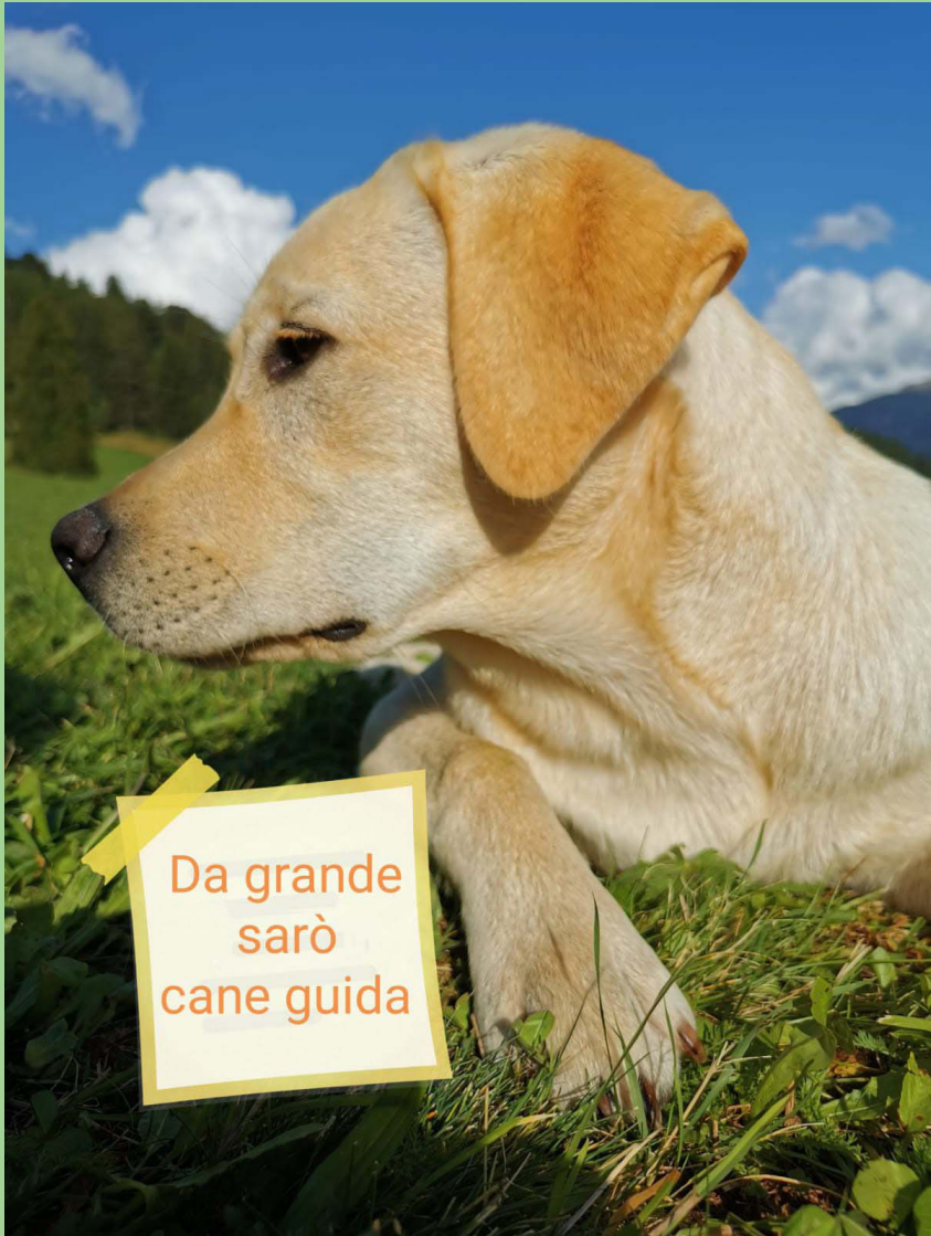
Immagine del busto di un cane guida, labrador biondo, sdraiato su un prato, di profilo. In basso a sinistra un post-it riporta la scritta "Da grande sarò cane guida"